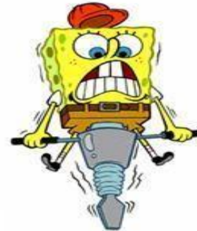
Ik doe mijn werk