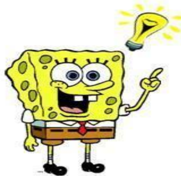
Hoe ga ik het doen?