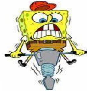
Ik doe mijn werk