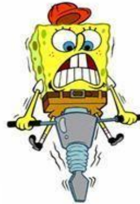
Ik doe mijn werk