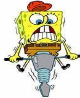
Ik doe mijn werk