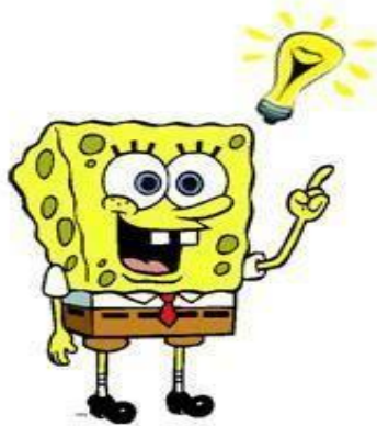
Hoe ga ik het doen?