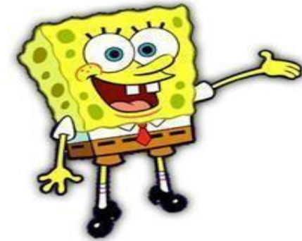
Ik kijk mijn werk na. Wat vind ik ervan?